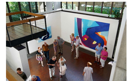
Aatifi – News from Afghanistan, Einzelausstellung im Museum für Islamische Kunst im Pergamonmuseum, Berlin, 2015