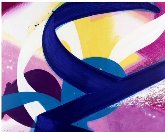
Ansicht 7 | 120 x 150 cm | Acryl auf Leinwand | Aatifi 2020