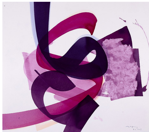
Verve 17 | 55 x 65 cm | Tusche auf Bütten 300g | Aatifi 2023